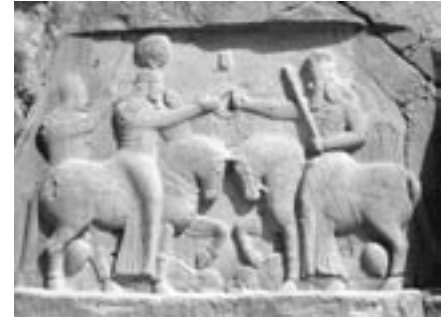
Den Persiske kejser Shapur II