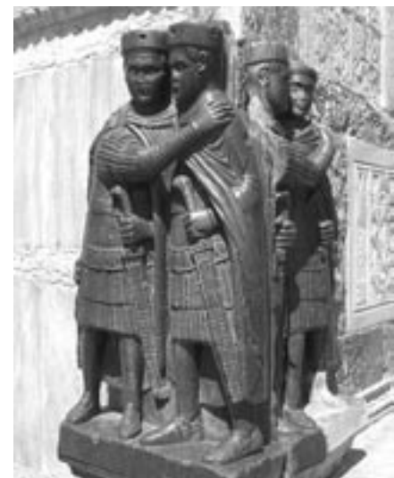
Billedlig fremstilling af Tetrakiet

En af de legioner, der blev beordret østpå, var Petulantes Legionen. De ønskede ikke at forlade Gallien, fordi hovedparten af solda-