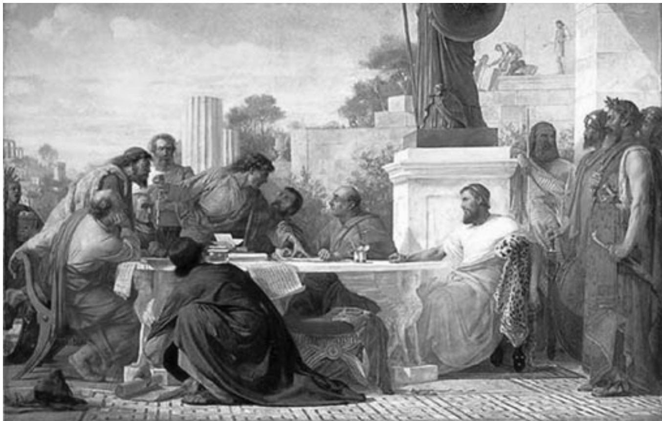
Edward Armitage: "Julian den frafaldne presiderer over en forsamling af sekterikere" 1875

for at proselytiserer. Han forbød kristne at undervise i de klassiske discipliner, retorik og grammatik. Julians holdning var, at de kristne, som underviste i de klassiske discipliner, ikke udviste den rette dyd, eftersom de latterliggjorde den fra forfædrene overleverede tro, som disse klassiske discipliner var bygget på.