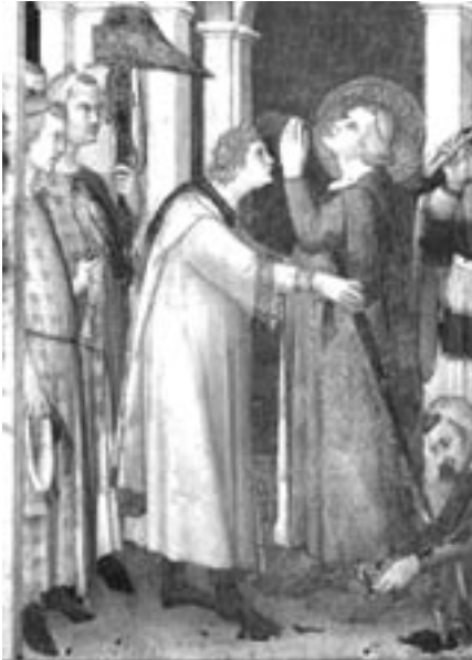
Ifølge legenden blev st. Martin slået til ridder af Julian den frafaldne.